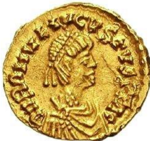
Na monecie widnieje wizerunek ostatniego cesarza rzymskiego – Romulusa Augustusa

Okres w dziejach kultury Grecji i Rzymu od ok. IX w. p.n.e. (czasy Homera) do upadku cesarstwa zachodnio-rzymskiego w V w. n.e. Określeniem zamiennym może być tu starożytność klasyczna . Epitet wskazuje na dominację Rzymu i języka łacińskiego. Jego wzorcową formę nazywano klasyczną (łac. classicus ).